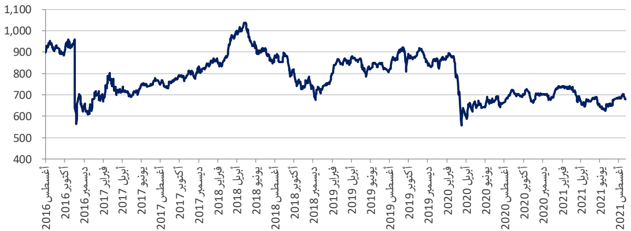
مؤشر EGX 30 مقوماً بالدولار الأمريكي

لم يتعاف المؤشر بالكامل بعد منذ الانخفاض السعري الذي شوهد في الأيام الأولى لجائحة كوفيد-19. في الواقع، نظراً للمستويات الحالية لمؤشر EGX 30 بالدولار الأمريكي، فإن المؤشر يتمتع بجاذبية الأيام الأولى من التعويم، حيث أن المستويات الحالية المسجلة هي تقريباً المستويات التي شوهدت في 15 نوفمبر 2016.